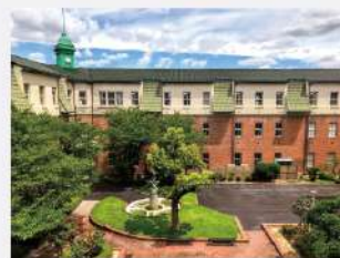
大阪府立工芸高等学校 本館 (大阪市指定有形文化財)

※1923年 大阪市立工芸学校開校 / 1948年 大阪市立工芸高等学校に変更 / 2022年 大阪府立工芸高等学校に名称変更